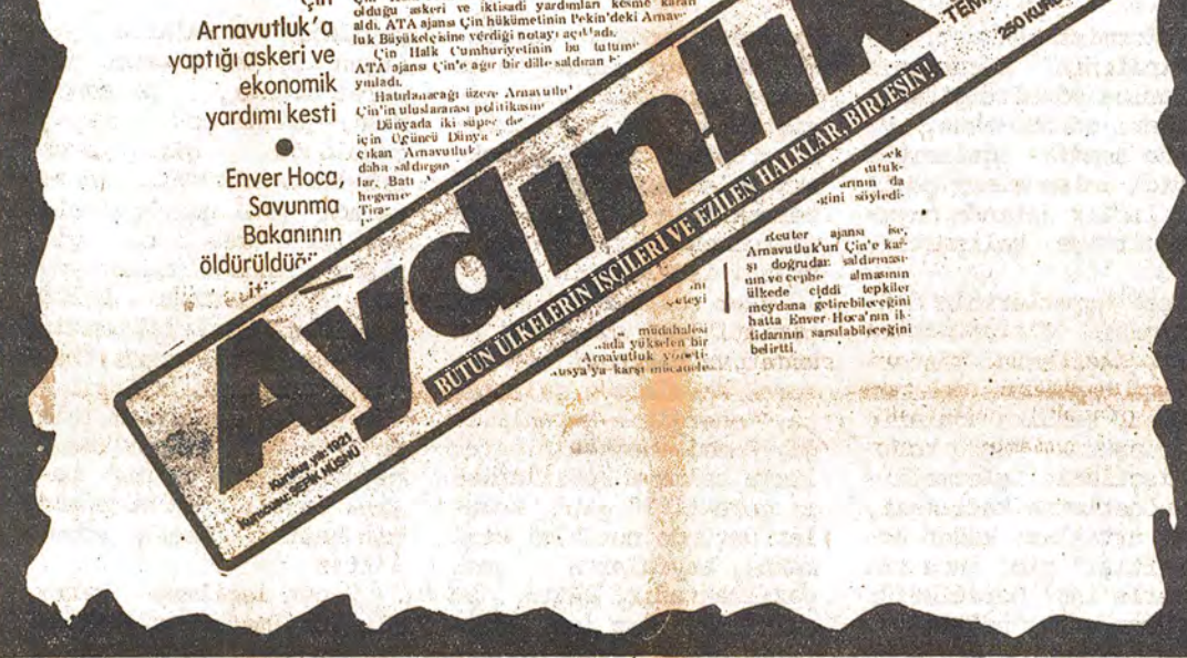
Aydınlık-TİKP revizyonistlerinin sosyalist Arnavutluk'a ve şanlı AEP'e karşı kusurlu yalan ve iftiralar, onların Marksizm-Leninizme olan güvenliklerinin bir göstergesidir.

Aydınlık revizyonistlerinin, sosyalist Arnavutluk'un, Kamboya'ya karşı Vietnam'a desteklediği iddiası. Bu iddia, devrimci öğretmenlerin emek ve mücadelesini parçalama politikasını sürdürüyor. Devrimci öğretmenlerin emek ve mücadelesini parçalama politikasını sürdürüyor.