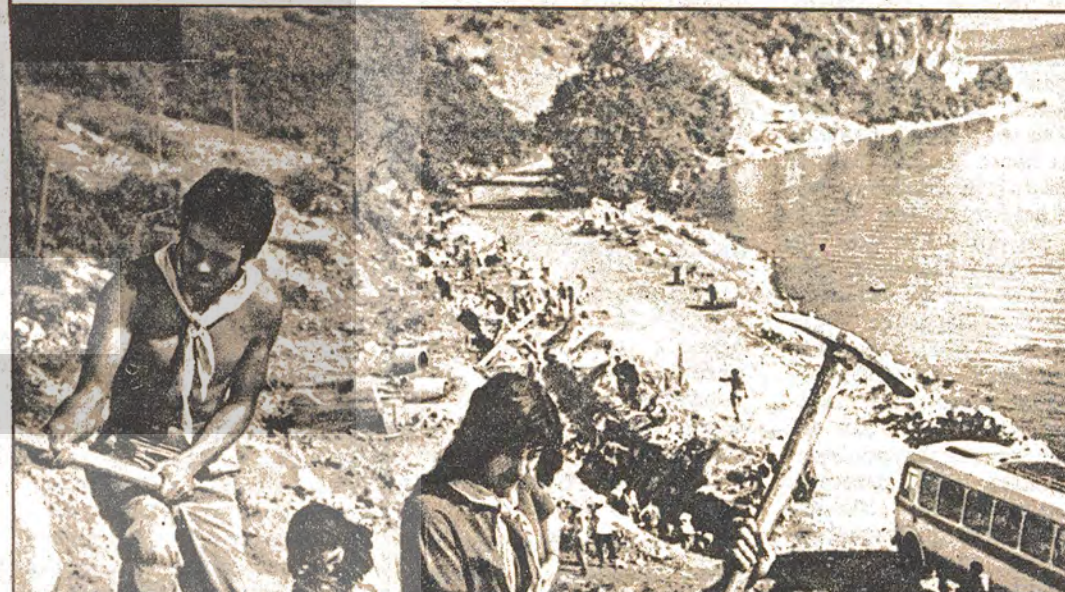
Azınlık halkı bir elinde kama, bir elinde silah proletarye diktatörlüğü altında devrimci sürdürüyor, sosyalizmi inşa faaliyetleri yürütüyor.

Leninizm savunucusu olmamış ve onun eşiğinden bir türlü sığma karşısında ti baskı kurmuştu. AEP ve Enver Hoca yoldaşlar devrimci öğretmenlerin emek ve mücadelesini parçalama politikasını sürdürüyor. Devrimci öğretmenlerin emek ve mücadelesini parçalama politikasını sürdürüyor.