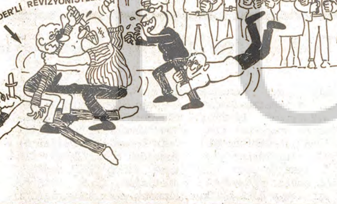
Sosyal-faşistlerin saldırıları öğretmen mücadelesini engellemeyi, engelleyemeyince